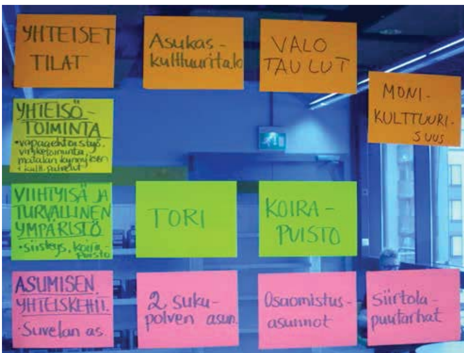
Kuva. Kehittäisteemojen kiteytyksiä asukaspajassa

maahanmuuttajien kehittyvässä toimijuudessa Espoon keskuksen alueella. Käyttäjälähtöinen innovaatiotoiminta haastaa alueen kehittäjät ja palvelujen tuottajat luomaan joustavia ja monipuolisia osallistumisen tapoja, jotta asukkaiden halu kehittää kotiseutuaan elinvoimaisemmaksi voidaan kanavoida yhteiseksi hyödyksi.