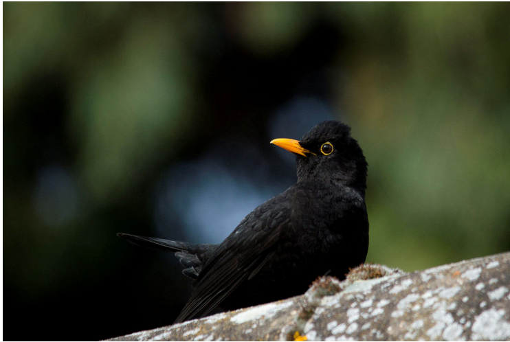
Kuva 1: Black Bird (Spinks 2014)

CC-lisensoitu kuva, haettu Openverse-palvelusta, sijainti Flickr: